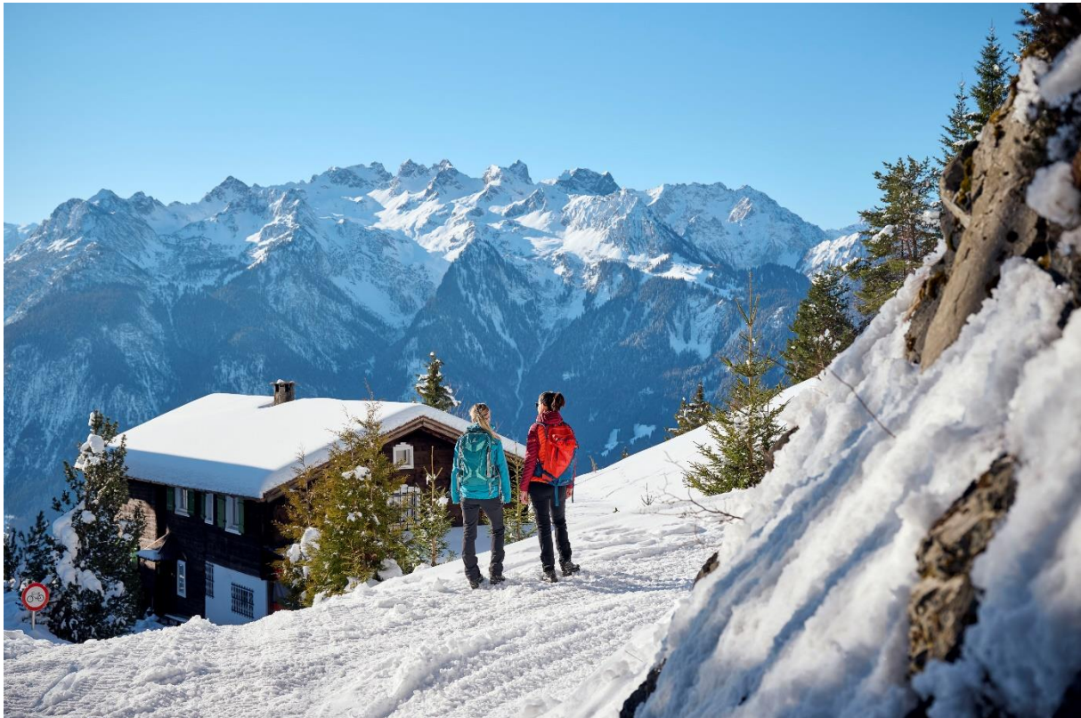
Winterwandern am Muttersberg