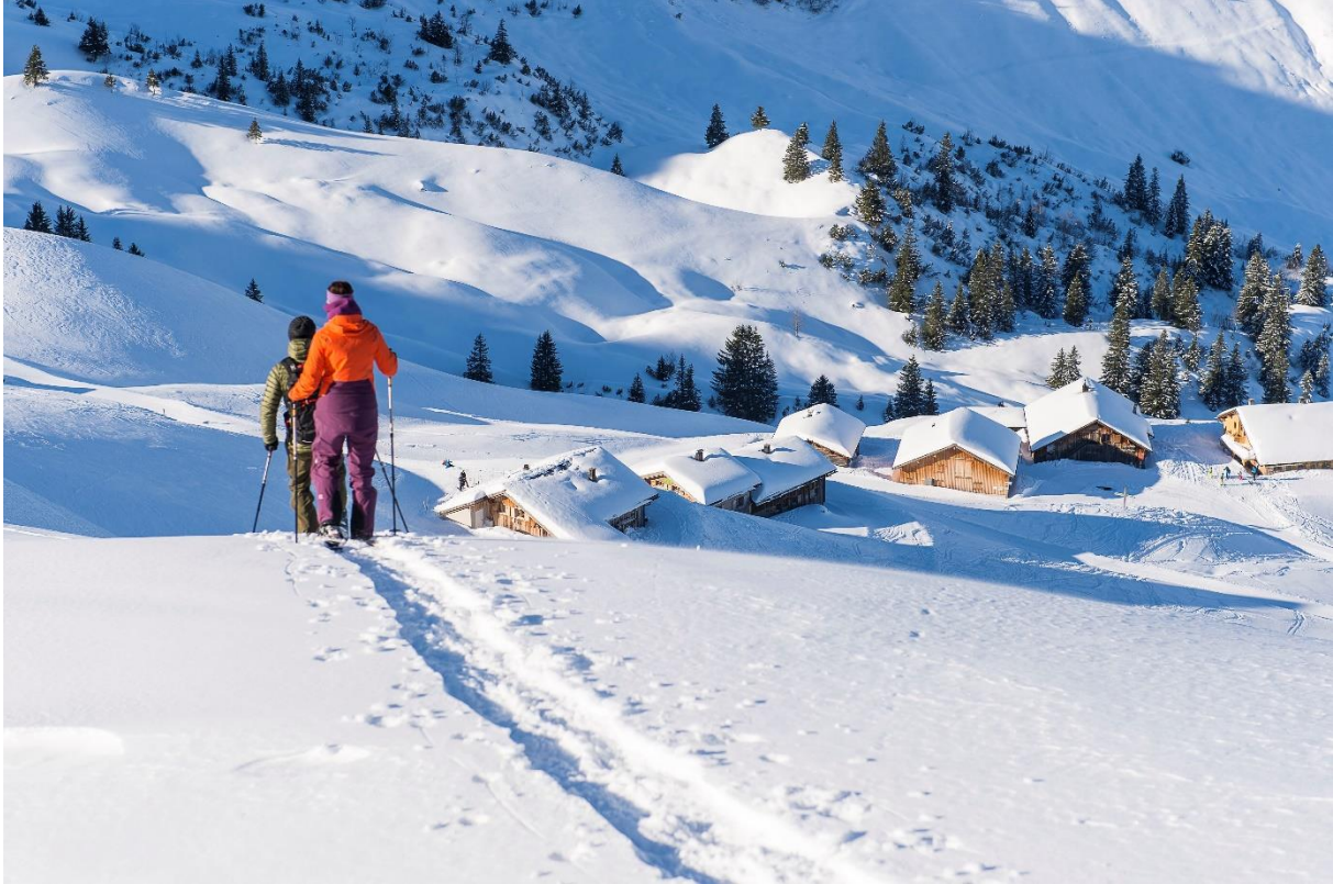
Idyllisch Winterwandern im Alpgebiet Sonntag-Stein GmbH