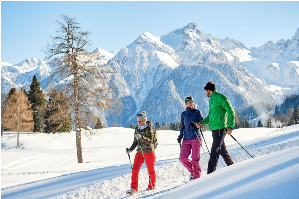
Mit Guide bei einer geführten Winterwanderung auf der Tschengla