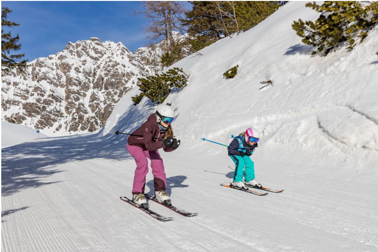
Ein Skigebiet für die ganze Familie: Brandnertal