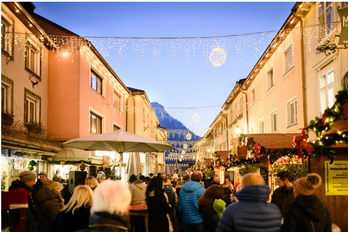
Stimmungsvoller Christkindlemarkt in der Altstadt von Bludenz GmbH